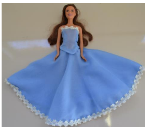
Figura 3: Vestimenta para boneca estilo Barbie

Com o intuito de viabilizar a confecção das vestimentas das protagonistas, optamos pela adaptação dos moldes para uma boneca estilo Barbie , o que contribui para o desenvolvimento do imaginário lúdico, ainda muito presente no período da adolescência, em que as alunas se encontram.