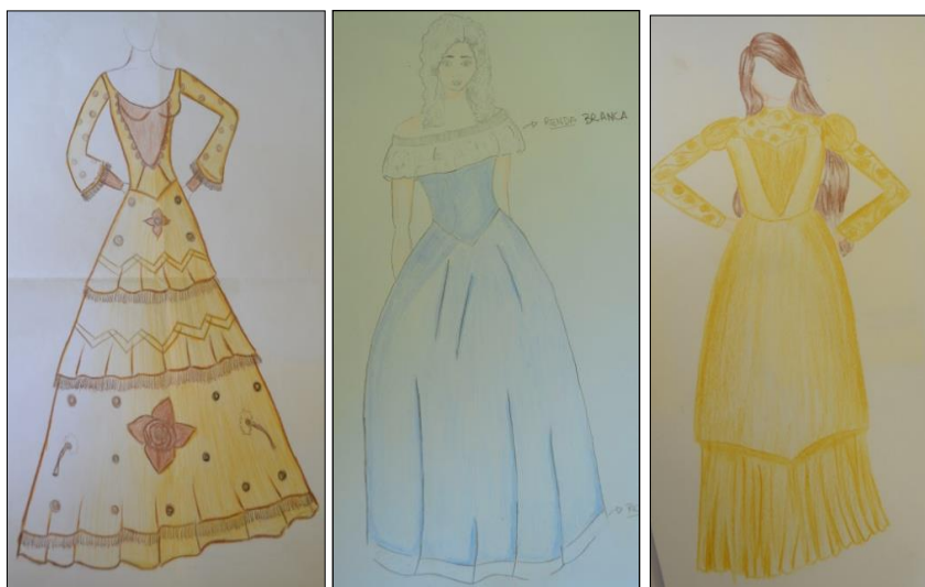
Figura 1: Desenho de moda das vestimentas das protagonistas