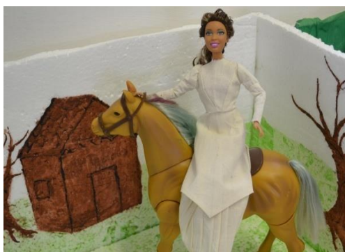
Figura 4: Representação do romance “Helena” de Machado de Assis

Como tarefa final, foi construída uma maquete que represente uma cena ou um período do romance lido, considerado pela aluna como sendo o mais marcante e significativo da história. Como podemos verificar nas Figuras 4 e 5.