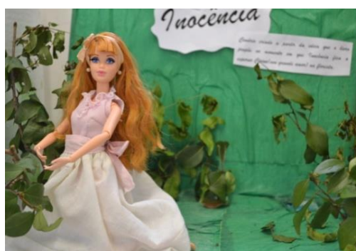
Figura 5: Representação do romance “Inocência” Visconde de Taunay