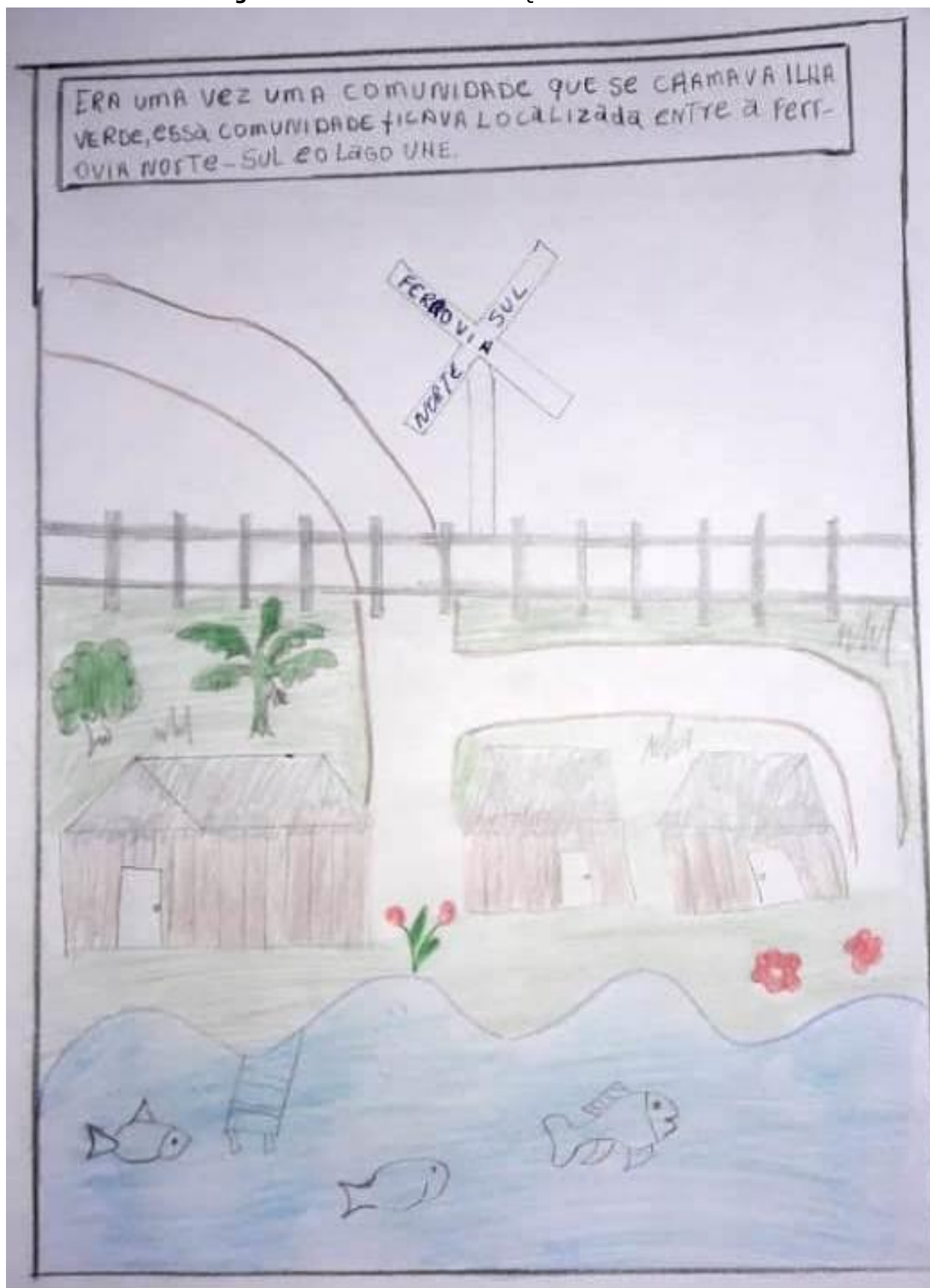
Figura 3 - Trecho da História em Quadrinhos da Aluna A.